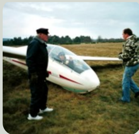
Startbereit beim Neujahrtsfliegen

schon zum Besuch des amerikanischen Präsidenten wurde während des G8 Gipfels der Luftraum über M-V stark